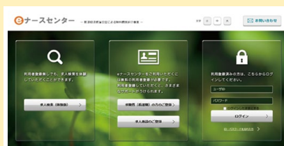
eナースセンターのトップページ