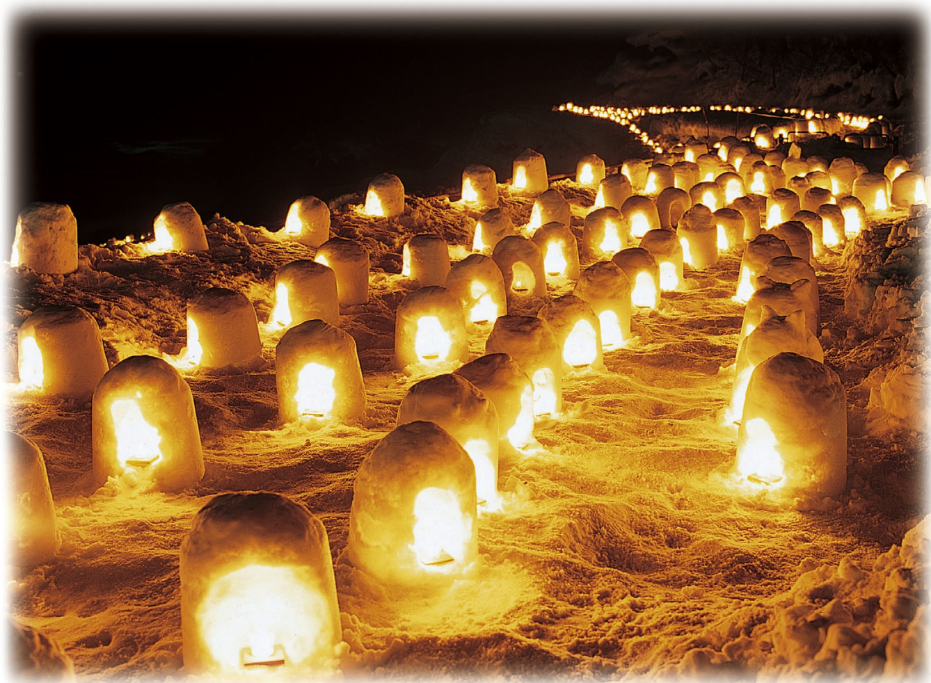
湯西川温泉かまくら祭 (日光市)