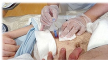
（胃ろう交換の様子）

これからも、自己研鑽を継続しながら在宅医と連携し、ご利用者やそのご家族が安心して在宅療養ができるように特定行為を活かしていこうと考えています。