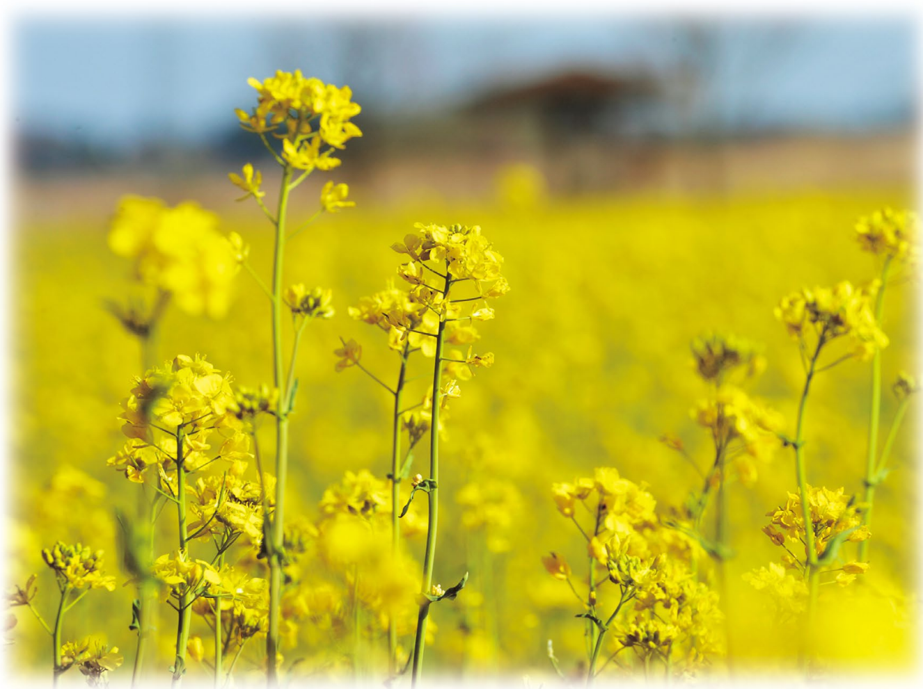
鬼怒グリーンパーク (高根沢町)