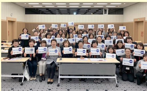
令和元年11月6日 日本看護協会にて 福井会長と共に