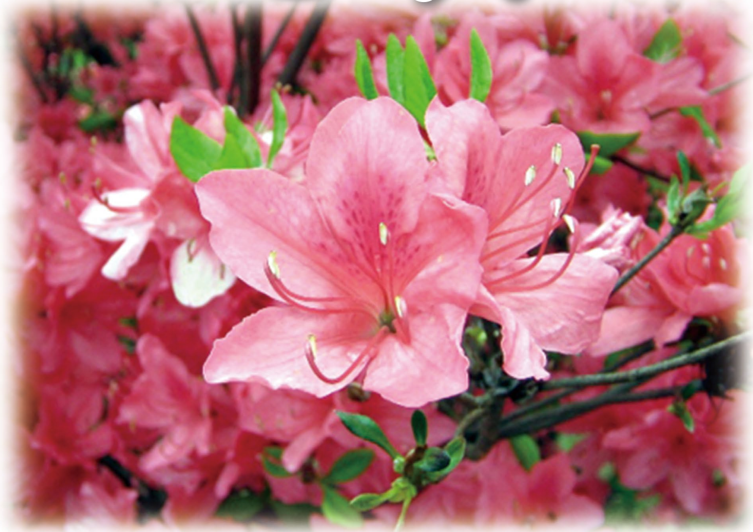
「長峰公園のつつじ」