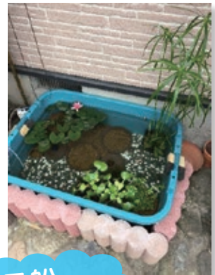
プラ船 ビオトープ